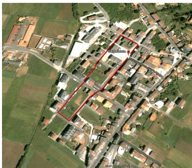
Percorrido categoría alevín