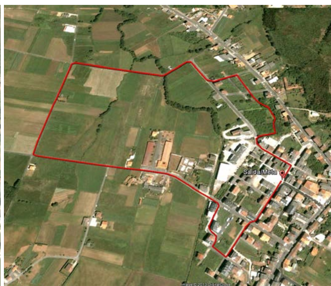
Percorrido categorías cadete e xuvenil