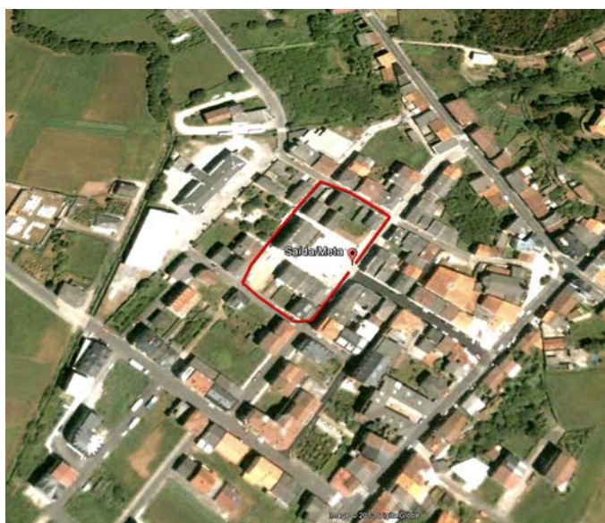
Percorrido categoría benxamín

Os atletas da categoría benxamín percorreren unha distancia aproximada de 300 m. sobre un percorrido que sairá da liña de saída, situada a altura da Praza do concello, na rúa Vázquez Mouzo. Pasará pola rúa do Candil, rúa Rosalía de Castro, rúa Curros Enríquez e outra vez rúa Vázquez Mouzo para chegar á meta.